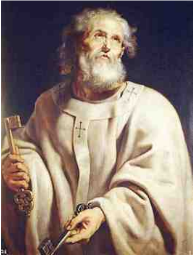
Petrus, door Peter Paul Rubens