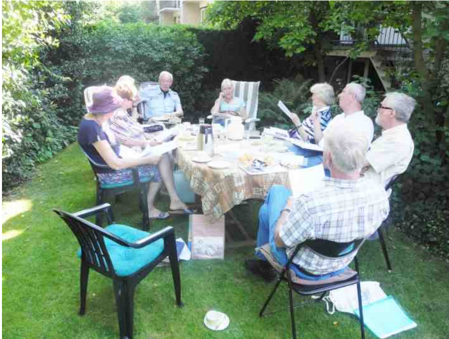
de klassieker leeskring – Grieks in het Gras; Latijn op het Land