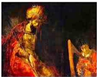
Saul en David