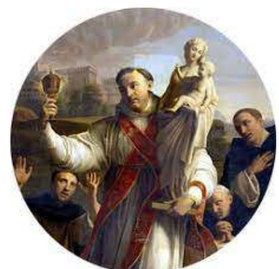
Hyacinthus redt Maria en de ciborie