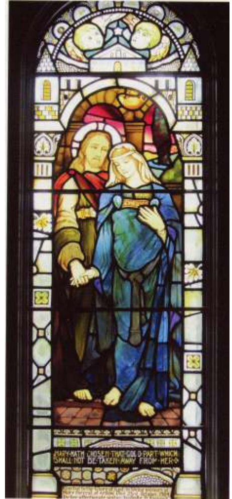
Kilmore Church, Schotland