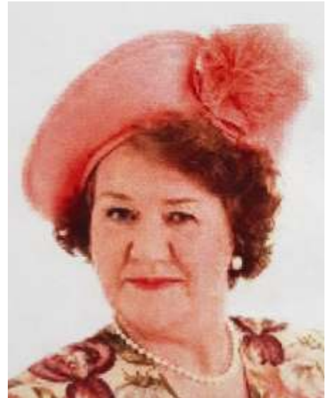
Patricia Routledge als Hyacinth Bucket