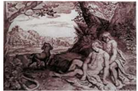
Apollo en Hyacinthus