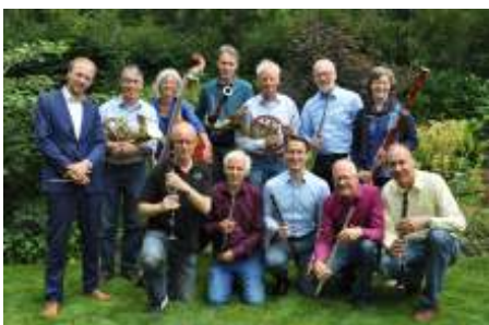
Voor de Wind

Verder horen we muziek van Dvorak, Strawinsky en Nono.