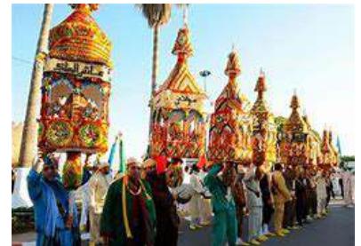
Mawlid in Marokko