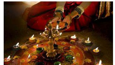
Diwali in India