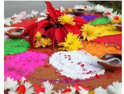
Tihar in Nepal