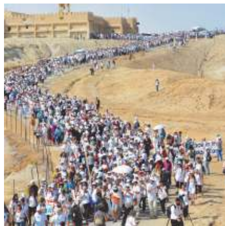
Mars van de hoop