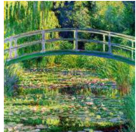
Waterlelies, Claude Monet