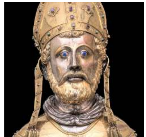
St. Servaas in de basiliek