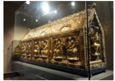
de Noodkist in de St. Servaas-basiliek

Pas in de tweede helft van de 19e eeuw kwam er weer aandacht voor de kerkschat doordat er veel over werd gepubliceerd. Vaderlandse geschiedenis en al wat daar bij hoort werd weer een belangrijk onderwerp. De architect Cuypers heeft bijgedragen aan restauraties, hij bedacht een 'historiserende constellatie' voor de Noodkist waardoor er ook weer meer pelgrims naar de basiliek trokken. De kist heeft op diverse plekken in de kerk gestaan, lang in de crypte, maar heeft nu een plek gevonden in het noordertransept. Zijn betekenis is in het verleden groot geweest, maar ook nu is er soms de behoefte om in tijden van nood in processie door de stad te gaan met de reliekschrijn. In 1991 was dat aan het begin van de Golfoorlog. Ook tijdens de coronaperiode wilden velen bij de Noodkist bidden. Maar er werd geen toestemming gegeven om door de stad te gaan, zodat werd besloten om de kist een plaats te geven in een grotere ruimte, toegankelijk voor iedereen. Eens per jaar, rond de feestdag van Sint Servaas