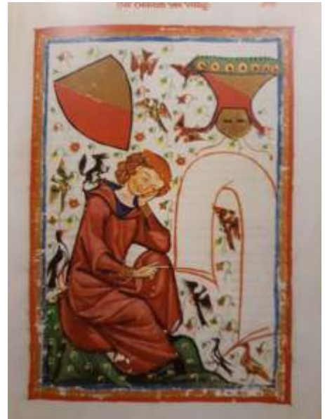
Heinric van Veldeke