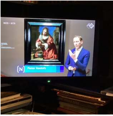
Sint Praxedis, 1655, Nat. Museum of Western art, Tokyo (on loan)