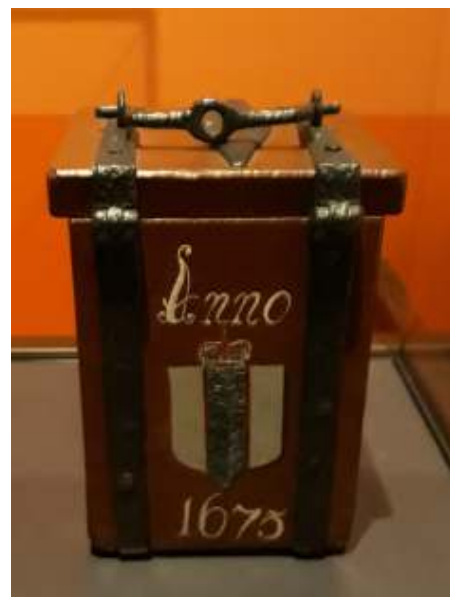
Een fraaie collectebus