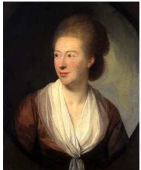
Belle van Zuylen

Opgave uiterlijk voor 21 maart bij Katrijne Bezemer 071-5320438 / kbezemer@iroka.nl