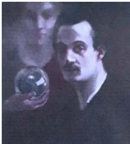
Zelfportret door Kahlil Gibran