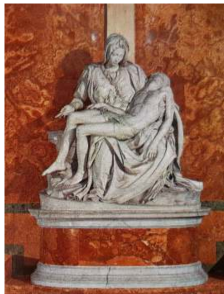
Piëta van Michelangelo