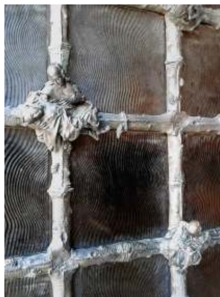
Notre Dame de la Treille