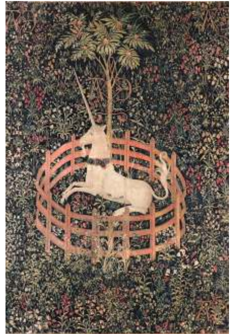
De gevangen eenhoorn, tapijt (1495) in Metropolitan Museum of Art, New York

Graag doen we alsof ons leven een reis is, een weg die ergens heen voert. De eigen levensreis als tocht vol verrassingen en/of ontberingen. De redding van jezelf na tegenslagen en/of begrip na moeilijke tijden... Djelal al-din Rumi beschrijft de levensweg in het gedicht Lied van de Karavaan , als een reis waartoe je steeds opnieuw van hogerhand wordt uitgenodigd: